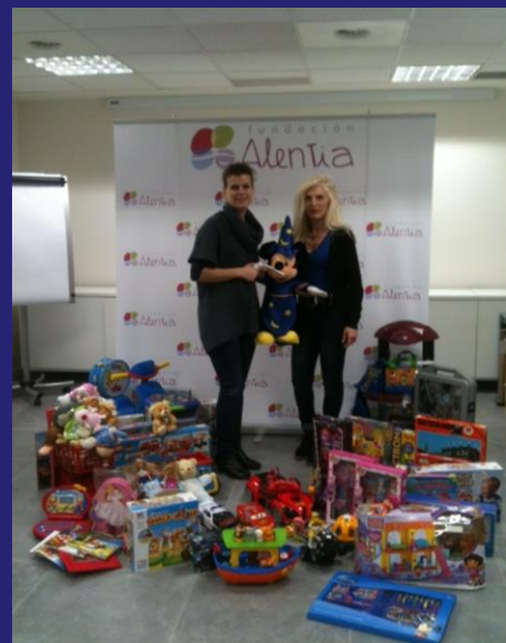
Entrega de juguetes a diferentes entidades