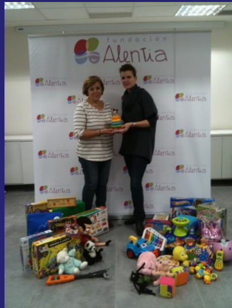
Imagen de la campaña y entrega de juguetes