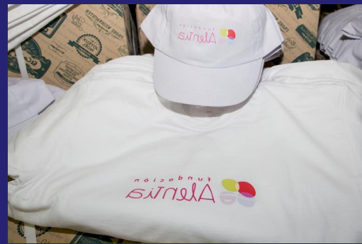
Regalos concurso Postales Navideña Cestas de comida y merchandising