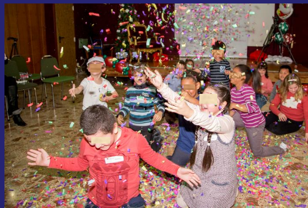
Papa Noel entregando regalos